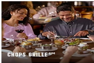
CHOPS GRILLE SM