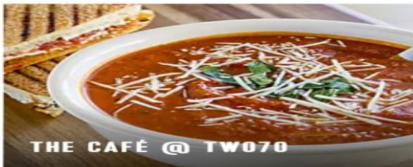
THE CAFÉ @ TW070