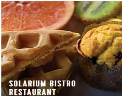
SOLARIUM BISTRO RESTAURANT