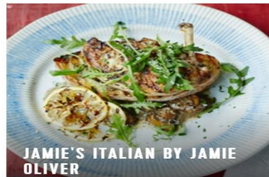
JAMIE'S ITALIAN BY JAMIE OLIVER