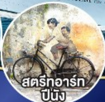
สตรีทอาร์ต ปีนัง