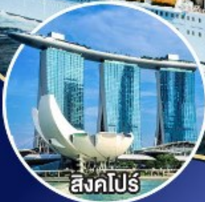
สิงคโปร์