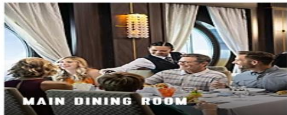
MAIN DINING ROOM