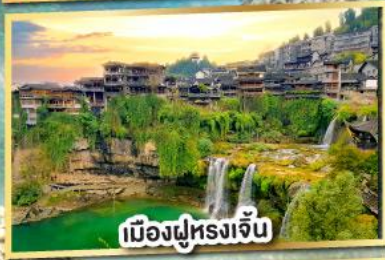
เมืองฝูหยงจัน