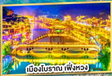
เมืองโบราณ เฟิ่งหวง