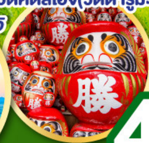
วัดคัตสึโฮจิ(วัดดาร์มะ)