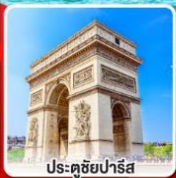
ประตูชัยปารีส

มือสุดพิเศษสุดปัง รับประทานอาหาร ระหว่างล่องเรือชมแม่น้ำแซนน์ และรับประทานอาหารบนหอไอเฟล