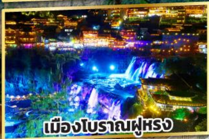
เมืองโบราณฝูหรง