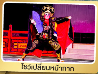
โชว์เปลี่ยนหน้ากาก