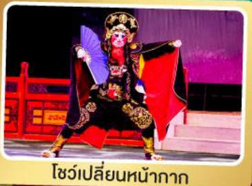
โชว์เปลี่ยนหน้ากาก