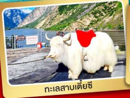
ทะเลสาบเตยซี