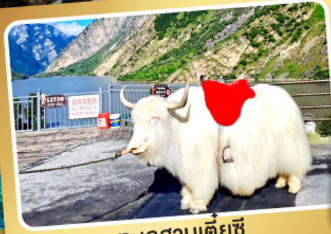
ทะเลสาบเตี้ยซี