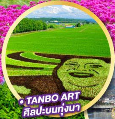
TANBO ART ศิลปะบนทุ่งนา