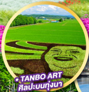
TANBO ART ศิลปะบนทุ่งนา