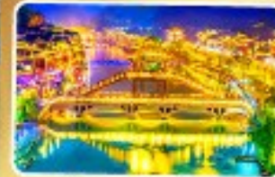
เมืองโบราณเฟิงหวง