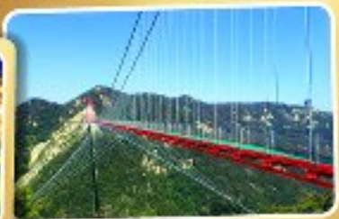
สะพานแวงอ้ายจ้าย