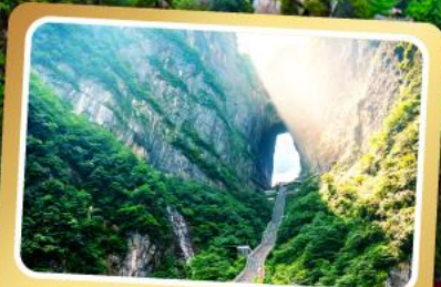
เวาเทียนเหมินซาน

ทริปเดียวเที่ยว 2 เมืองโบราณ ฝูหรงและเฟิ่งหวง ลัมรส สุกี้เห็ด บั๊อย่างเกาหลี เปิดปักษ์