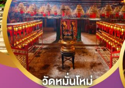
วัดหมื่นโหม่