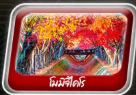
โคมิจิไดริ

สายการบิน AirAsia X (XJ) น้ำหนักกระเป๋า 20 KG