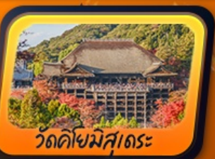
วัดคิโยมิสึเดระ