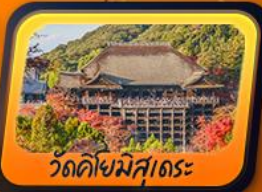
วัดคิโยมิสุเดระ

พักรู้ออนเซ็น 1 คืน กิฟุ 1 คืน โทยาม่า 1 คืน นาริตะ 1 คืน