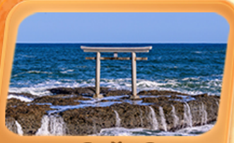
ศาลเจ้าโออาไรโอชิซาทิ

แพคเกจใกล้ชิด "ฟูจิซัง" ที่หมู่บ้านโอชิโนะ อักโท สวนโออิชิปาร์ค ที่เที่ยว Unseen นั่งกระเช้าชมวิวภูเขาสิคุยะ ศาลเจ้าโออาไรโอชิซาทิ ศาลโทริอิริมทะเล อลังการโบสถ์เปลี่ยนสี น้ำตกเคจอน ศาลเจ้านิกโกโทโชกุ เสริมมงคล วัดพระใหญ่อุซึคุ โดบุคสี ห้ามพลาดโคมแดงยักษ์ วัดอาซากุสะ อิมมอร์ทัลตลาดปลาโทโยสุ ภัตตาคารแนว 3D ย่านชิจูกุ ซุปปิ้งจุใจย่านดังชิบูย่า