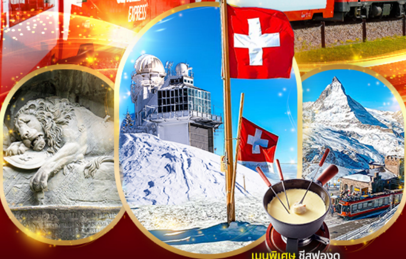
เมนูพิเศษ ชีสฟองดู