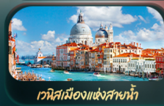
เวนิสเมืองแห่งสายน้ำ