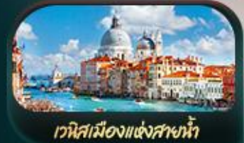
เวนิสเมืองแห่งสาขาน้ำ

เมนูพิเศษ!! พิซซ่ามาการิตา, สเปากัดตีหมักดำ, หอยเอสคาโต