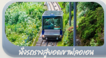
นั่งรถรางสู่ยอดเขาฟลอม

สิทธิครั้งในชีวิตกับการนั่งรถไฟสายโรแมนติกฟลัมสบาน่า ล่องเรือชมพยอร์ด ขึ้นกระเช้าลอยฟ้าพิชิตยอดเขาอูลริกัน เบอร์กิน นั่งรถรางสู่ยอดเขาฟลอมชมวิวเมือง ออสโล เยี่ยมชมโอเปร่าเฮาส์ มหาวิหารออสโล ป้อมปราการอาครส์ฮูส สวนมนุษย์ชาติ Vigeland Sculpture Park