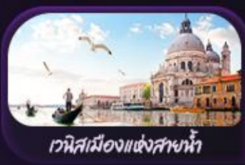
เวนิสเมืองแห่งสายน้ำ