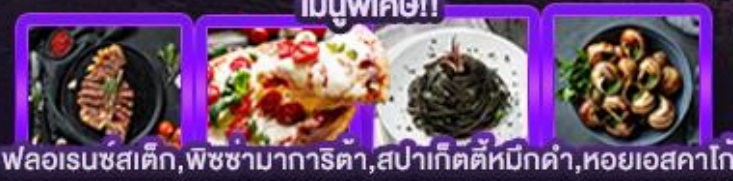
พลอเรนซสติก, พิชชามากาเร็ตา, สเปาเก็ตตีหมึกดำ, หอยเอสคาโท