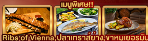
Ribs of Vienna, ปลาเทราสียง, จาหมูเยอรมัน

ตะลุยพีชิตยอดเขาซูกสปิตเซ "Top of Germany" เยือนเมืองมิวนิก จัตุรัสมาเรียนพลัทซ์ สัมผัสเมืองมรดกโลก เซสท์ กรุงลอฟ เยี่ยมชมปราสาทปราก ย้อนรอยอดีตซาลซ์บูร์ก สวนมิราเบล บ้านเกิดของโมสาร์ท ปราสาทบราติสลาวา มหาวิหารเซนต์มาร์ติน สุดโรแมนติกส่องเรือชมความงามแม่น้ำดานูบ จัตุรัสวีรบุรุษ พระราชวังฮอฟบวร์ก ตื่นตากับความน่าหลงใหลของ หมู่บ้านริมทะเลสาบฮัลล์สตัดท์ พระราชวังเซินบรูน์ ปักกายฮิปโปบิงจู่ใจ