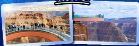
ชมความยิ่งใหญ่ของ GRAND CANYON WEST SKYWALK