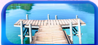
หมู่บ้านอิชเลทวอลด์