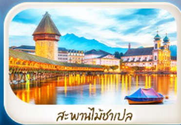
สะพานไม้ชาเปิล