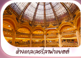
ห้างแลuvreลูฟวร์