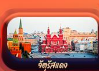
จัตุรัสแดง