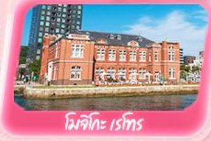
มิซึคิโตะ เรโอรุ