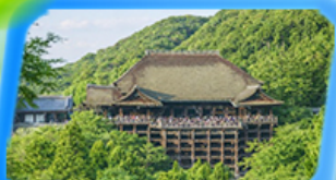
วัดน้ำใสคิโยมิสุเดระ