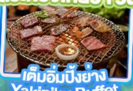
เติมอัมปียงย่าง Yakiniku Buffet