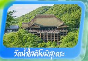
วัดน้ำใสคิโยมิสุเดระ