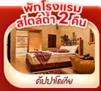
พักโรงแรม สัปดาห์ 2 คืน