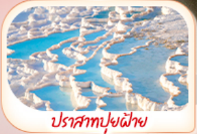
ปราสาทปูยีฟาย