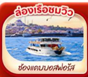
ล่องเรือชมวิว

พิเศษ! ล่องเรือชมความสวยงามช่องแคบ 2 ทวีป “ช่องแคบบอสฟอรัส”