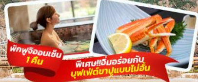
แพ็คเกจ 1 คืน พิเศษ! อิ่มอร่อยกับบุฟเฟ่ต์ชาบูแบบไม่อั้น

เที่ยวครบทุกวัน เดินทาง เมษายน - มิถุนายน 67 สายการบิน Air Asia X (XJ) น้ำหนักกระเป๋า 20 KG