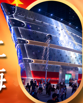
เรือคองคอลลี