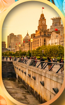
หาดไว่ทกาน