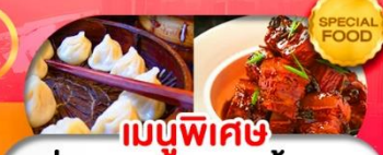
เมนูพิเศษ เสี่ยวหลงเปา หมูน้ำแดง เดินทาง ต.ค. 69 - มี.ค. 70