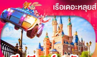
มีฟรีเคย์ 1 วัน เลือกซื้อทัวร์เสริมดิสนีย์แลนด์