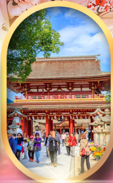
ศาลเจ้าดาโชฟู