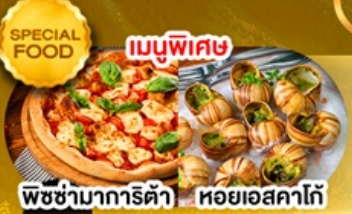
พิซซ่ามาการิตต้า หอยแอสคาโก้