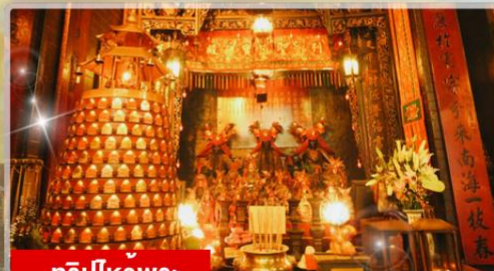
ทริบไหว้พระ