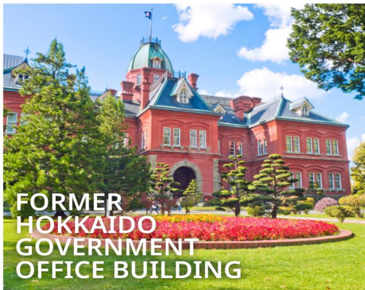
FORMER HOKKAIDO GOVERNMENT OFFICE BUILDING

เป็นตึกสไตล์นีโอบารอค มีลักษณะพิเศษที่มีหลังคายอดแหลมและกรอบหน้าต่างเป็นเอกลักษณ์ เปรียบเสมือนอนุสาวรีย์การบุกเบิกของฮอกไกโด ปัจจุบันได้รับการขึ้นทะเบียนเป็นมรดกทางวัฒนธรรมของชาติ