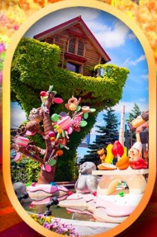
โรงงานช็อกโกแลต