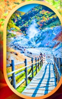
หุบเขานรกจิกุคคาบิ