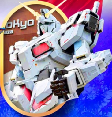
ห้างไอโดะบะกันดัม