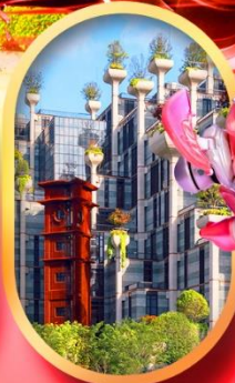
อาคารพินตันไ้