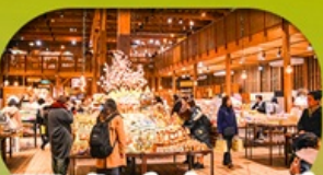
พิพิธภัณฑ์กล่องดนตรี Otaru Music Box Museum