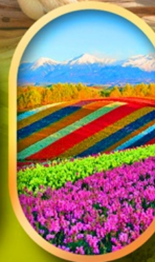
สวนดอกไม้ชิชิโกะ