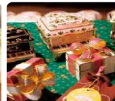
กล่องดนตรี MUSIC BOX