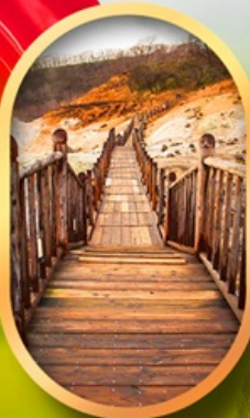
หุบเขาจิกุกดาบิ