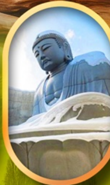
เนินเขาแห่งพระพุทธรเจ้า