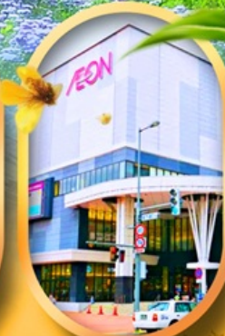
อ็อนมอลล์