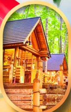
นิงเกิ้ลเกอเรส