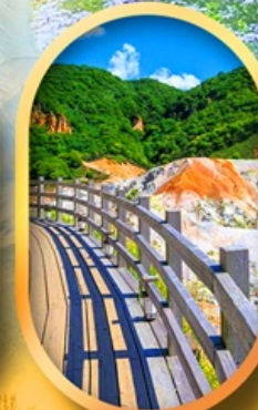
โนโบริเบ็ทสึ