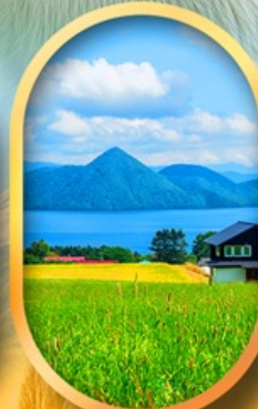
ทะเลสาบโทโยะ