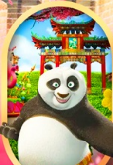
OPTION Universal Studios