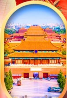
พระราชวังกุ๊กง