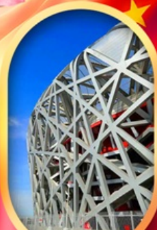
ผ่านชมสนามกีฬาฟาริงก