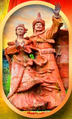
เมืองโบราณชางพาน