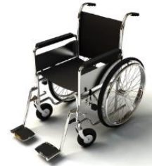
การรับบริการดูแลเป็นพิเศษ

กรณีผู้เดินทางต้องการความช่วยเหลือเป็นพิเศษ อาทิเช่น การใช้วีลแชร์ กรุณาแจ้งบริษัทฯ อย่างน้อย 7 วันก่อนการเดินทาง มิฉะนั้นบริษัทฯ จะไม่สามารถจัดการล่วงหน้าได้ เนื่องจากการขอใช้วีลแชร์ในสนามบินนั้น ต้องมีขั้นตอนในการขอล่วงหน้า และบางสายการบินอาจมีการเรียกเก็บค่าใช้จ่ายทั้งทางสนามบินในไทยและในต่างประเทศ ซึ่งผู้เดินทางสามารถสอบถามกับเจ้าหน้าที่ได้โดยตรงก่อนทำการจอง และหากในขณะของท่านมีผู้ต้องการดูแลพิเศษ เช่น ผู้ที่นั่งรถเข็น (Wheelchair), เด็ก, ผู้สูงอายุและผู้ที่มีโรคประจำตัวหรือไม่สะดวกในการเดินทางท่องเที่ยวในระยะเวลาเกินกว่า 4 - 5 ชั่วโมงติดต่อกัน ท่านและครอบครัวต้องให้การดูแลสมาชิกภายในครอบครัวของท่านเอง เนื่องจากการเดินทางเป็นหมู่คณะ หัวหน้าทัวร์มีความจำเป็นต้องดูแลคณะทัวร์ทั้งหมด