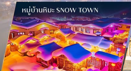
หมู่บ้านหิมะ SNOW TOWN

ควอนเฟโรมออกเดินทาง ตั้งแต่ 15 ท่าน ขึ้นไป