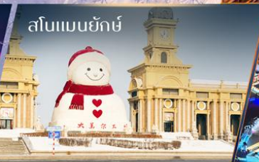
สโนว์แมนยักษ์