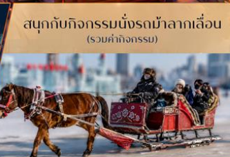
สนุกกับกิจกรรมนั่งรถม้าลากเลื่อน (รวมค่ากิจกรรม)