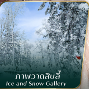
ภาพวาดหิมะ Ice and Snow Gallery

คอนเฟิร์มออกเดินทาง ตั้งแต่ 15 วัน ขึ้นไป