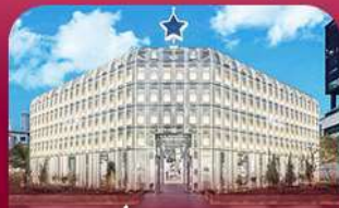
ชานซองซู