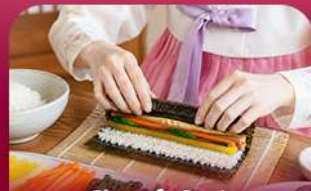
เรียงหน้าทำคิมบับ

สัมผัสเสน่ห์ฤดูหนาวของเกาหลีแบบอบอุ่นหัวใจพิเศษ! พักที่รีสอร์ท 1 คืน ท่ามกลางบรรยากาศหิมะขาวโพลน สนุกกับกิจกรรมฤดูหนาวยอดนิยม ทั้งสกี สโนว์บอร์ดและสโนว์สไลด์ ก่อนออกเดินทางสู่เกาะนามิ ดินแดนแห่งความโรแมนติก ชมสตรอว์เบอร์รี่หวานฉ่ำ สด ๆ จากฟาร์ม พร้อมเรียนทำคิมบับเมนูยอดฮิตสไตล์เกาหลี ปิดท้ายด้วยการช้อปปิ้งสุดฟินที่เมืองคยองและซองซู ย่านฮิดกึสายคาเฟ่และสายแฟชั่นห้ามพลาด