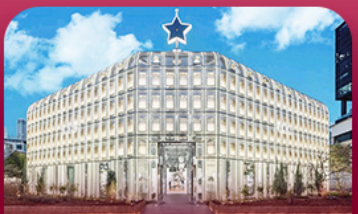
ย่านซองซู