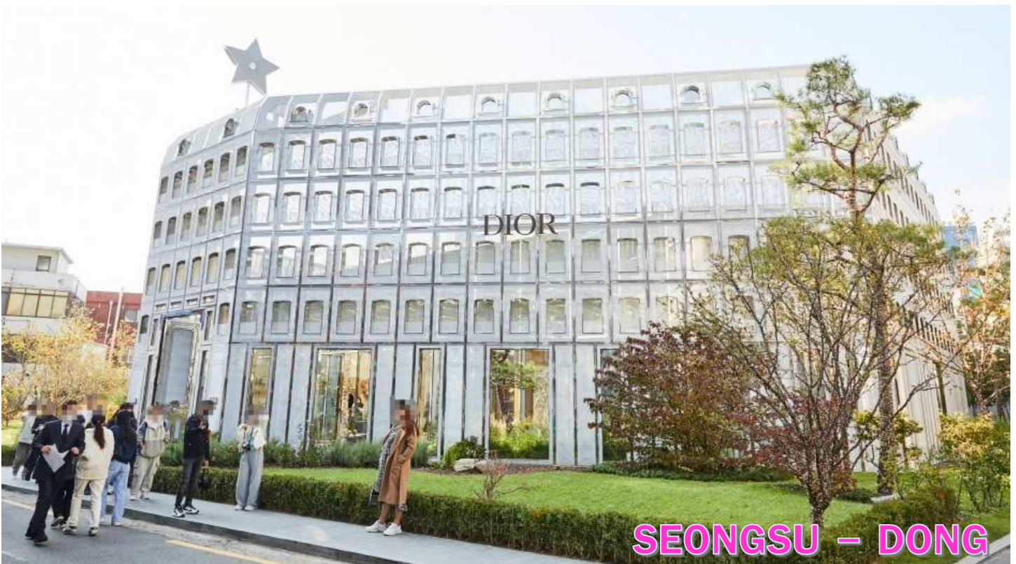
SEONGSU - DONG

รับประทานอาหารกลางวัน ณ ภัตตาคาร เมนูเทศกาลปี เมนูขึ้นชื่อจากเมือง ซุนซอน เป็นอาหารเกาหลีรสเผ็ดหวานที่โดดเด่นด้วยเนื้อไก่หมักซอสโคชูจังเข้มข้น ผสมพริกป่น กระเทียม ซีอิ๊ว และเครื่องปรุงสูตรพิเศษ หมักจนซึมเข้าเนื้อ ก่อนนำไปผัดบนกระทะร้อนพร้อมกะหล่ำปลี หอมใหญ่ มันหวาน และเส้นต็อกเหนียวนุ่ม ให้รสชาติกลมกล่อม หอมเครื่องเทศ นิยมรับประทานร้อน ๆ คู่กับข้าวสวย หรือเพิ่มซีสียัด ๆ เพื่อเพิ่มความเข้มข้นและความอร่อยยิ่งขึ้น