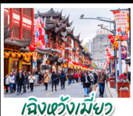
เมืองเซี่ยงเหมียว