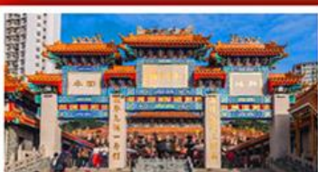
วัดเซว้งต้าเซียน