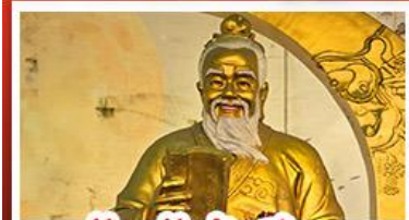
วัดเซว้งต้าเซียน

วัดเจ้าแม่กวนอิมฮ่องกง - กระเช้ามองปิง พระใหญ่โป้วหลิน - เจ้าแม่กวนอิมรัฟส์เบย์ วัดแชกงหมิว - วัดหวังต้าเซียน - วัดเจ้าแม่ทับทิม