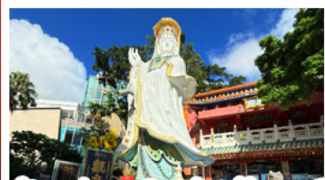
เจ้าแม่กวนอิมรพีลส์เบย์