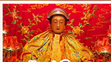
วัดเล่งจื๊อเมว