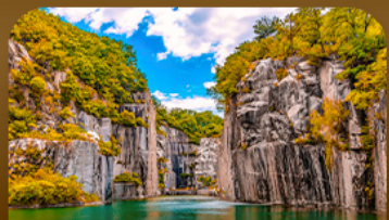
เขมเขาดิกละเมืองโพเชอน

26 - 30 W.ย. 69 21,900 03 - 07 ธ.ค. 69 21,900 09 - 13 ธ.ค. 69 21,900