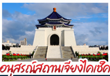
อุทยานสถานเจียงไคเช็ค