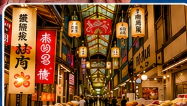
ตลาดปลาชิซึกิ